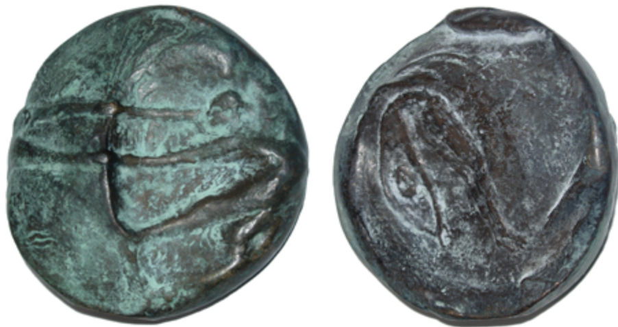
&lt; Legpenning &gt;

De ontvanger van de onderscheiding wordt gevraagd een lezing te geven over zijn of haar activiteiten in het reddingwezen. In deze bijeenkomst zal de Maatschappij het veld van het reddingwezen in brede zin betrekken.