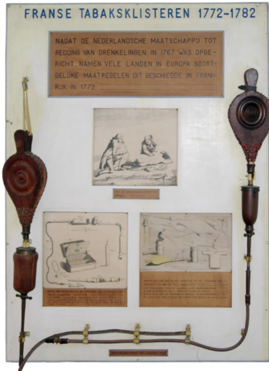
Historische reanimatie apparatuur (Dorus Rijkers Museum)