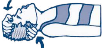
Hoofd achterover Hand in de nek